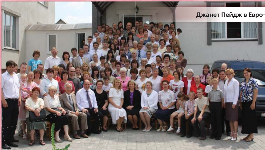
Участники молитвенной конференции в Минске, Белоруссия