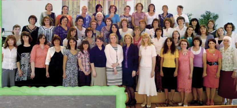
Встреча жен служителей в Киеве, Украина