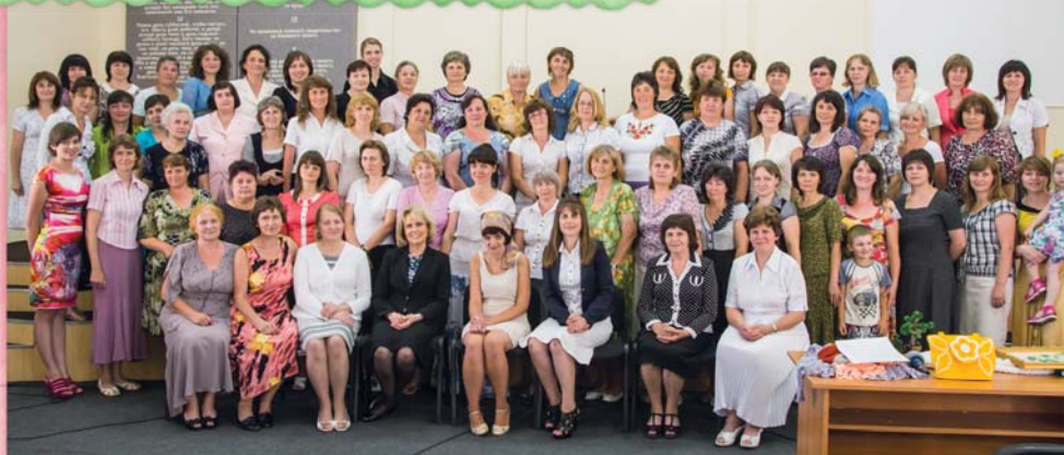
Встреча жен служителей и пресвитеров в г. Черкассах, Украина