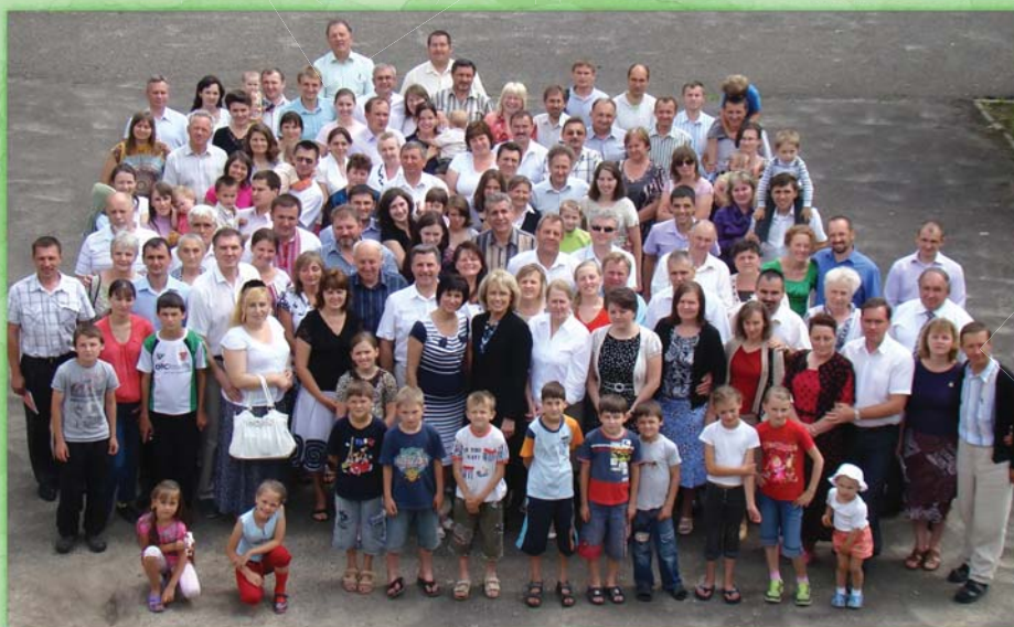
Встреча семей служителей Западной Конференции УУК в санатории «Барвинок»